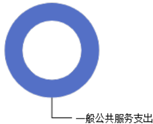
一般公共预算当年拨款结构图

2023年度一般公共预算当年拨款69.51万元，主要用于以下方面：一般公共服务支出69.51万元，占100.00%。